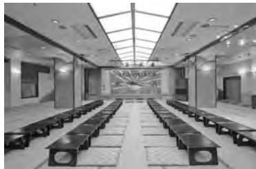
和宴会場(大宴会場さかみづき)