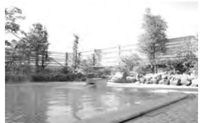
天然温泉露天風呂