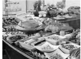
和洋バイキング(夕食)