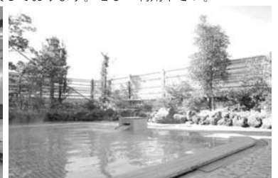
天然温泉露天風呂

マホロバ・マインズ三浦 〒238-0101 神奈川県三浦市南下浦町上宮田 3231