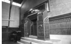
増田の内蔵(横手市)(イメージ)