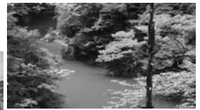
抱返溪谷(仙北市)(イメージ)