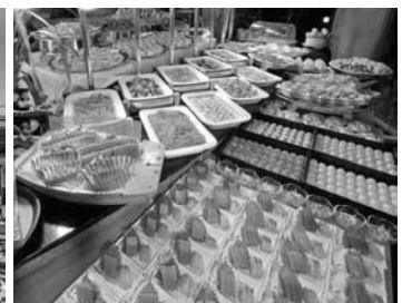
和洋バイキング(夕食)