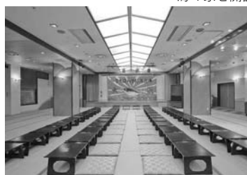
和宴会場(大宴会場さかみづき)