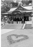
【伊豆の国パワーマパーク】