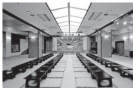
和宴会場(大宴会場さかみづき)

※ご予約は不要です。券売機の入浴券はお買い求めにならず、直接フロントにお越しの上、会員証、退職優待証、リフレッシュ補助券(使用の場合)をご提示ください。 ※リフレッシュ補助券は合計2,000円以上の場合にご利用いただけます。