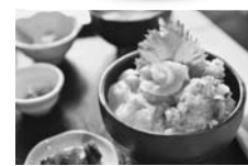
【伊豆稲取さんめ処 なぶらとと】