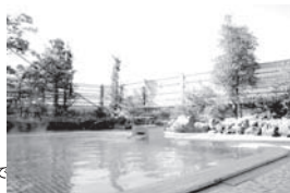
天然温泉露天風呂