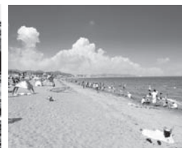
三浦海岸海水浴場(7月~8月)

下記料金は1室3~5名様のご利用の場合です。 ※別館の客室は海が望めないお部屋がございます。