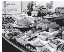
三浦の幸満載 和洋バイキング