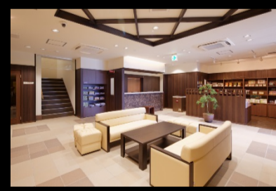
落ち着いた雰囲気のリビー