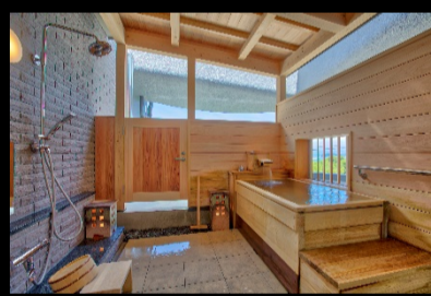
客室露天風呂 高野横風呂