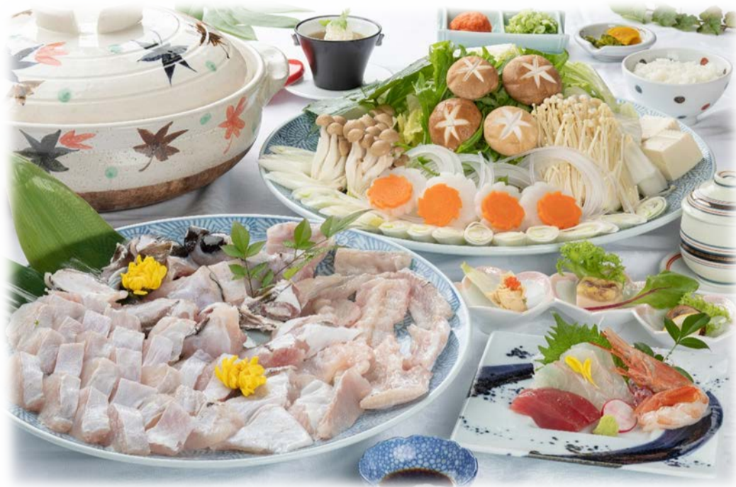
※写真は4人盛りのイメージです。