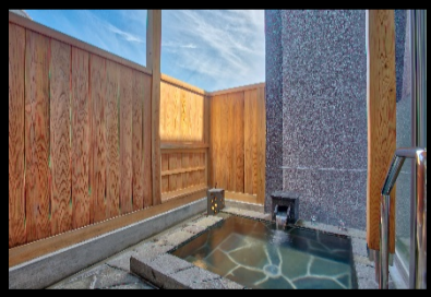
客室露天風呂 岩風呂