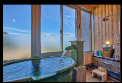
客室展望陶器風呂