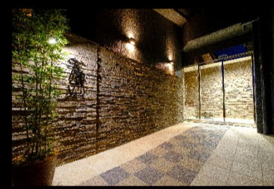
和風モダンへのアプローチ