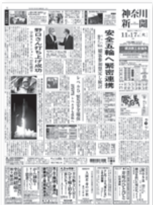
3回目の野口さんの 打ち上げ成功を報じた紙面 2020(令和2)年11月17日付