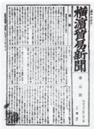
神奈川新聞の前身紙の一つ 「横浜貿易新聞」創刊号(第1号) 1890(明治23)年2月1日付

神奈川新聞社は2020年2月1日、創業130周年を迎えました。明治の横浜貿易新聞から令和まで130年間の元日1面を一挙展示するほか、過去の貴重な報道写真などを紹介。神奈川新聞の歩みとともに神奈川県と県民の姿を伝えます。途中、震災や戦争という困難はありましたが、130年にわたり新聞を発行し続けるという決意を、タイトル「ペンを止めるな!」に込めました。また、新聞という「ものづくり」を知っていただく、ペンで記事を書いていた約40年前の編集・制作現場を再現します。そして、現在の取り組みを「知る」「分かる」「参加する」のテーマで展示。デジタルのニュース配信やドローン空撮、またSNSなどを通じて読者からの身近な疑問に取材班が応える企画などさまざまな「挑戦」をご覧ください。