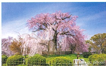
円山公園 (約640m / 徒歩8分)