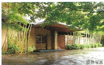
美濃吉本店 竹茂楼 (150m / 徒歩2分)

「東山」駅より徒歩約4分。この場所なら、「東山」エリアの魅力のすべてを徒歩で満喫できます。東に「南禅寺」「哲学の道」、西に「鴨川」「祇園・先斗町」エリア、南に「青蓮院」「円山公園」、北に「平安神宮」「国立近代美術館」……。「京都東山」の醍醐味を全方位で謳歌する、何度も歩きたくなる“中心”がここにあります。