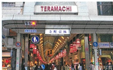
寺町京極商店 / 四条通り (1,600m / 徒歩20分)