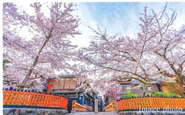
祇園白川 (約1,050m / 徒歩14分)