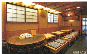
いづら (1,170m / 徒歩15分)