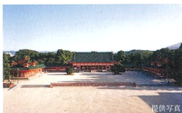
平安神宮 (約720m / 徒歩9分)