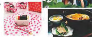
(写真は全てイメージです)

※お子様メニューはありません。幼児の方の食事は別注(各自払い)にてお願いいたします。 信玄餅の詰め放題は保護者の方と一緒にお願いいたします。