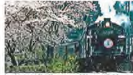
大井川鐵道SL 桜の季節です

17年かけて静岡県が作り出した最高傑作「きらび香」静岡県でのみ栽培可能な希少なイチゴです。