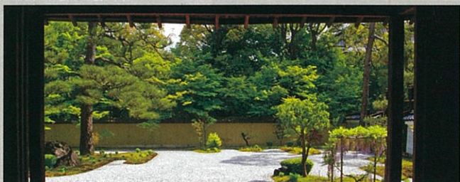
紫式部邸宅跡の廬山寺